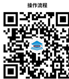
12. 高校师范类毕业生档案的转递