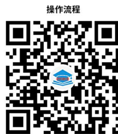
24.局直学校中考成绩查询