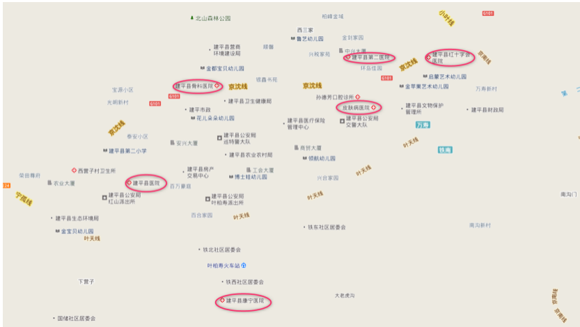
建平县中心城区医疗机构现状分布图