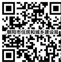
5.安全生产“三类”人员安全生产考核