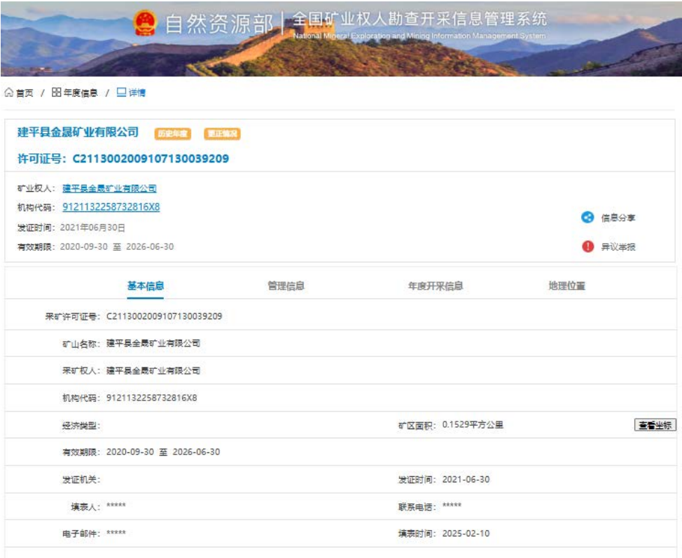
图5-1 自然资源部公示信息图片

经查询自然资源部网站，该矿采矿权权证登记信息与自然资源部网站公示信息一致，公示信息截图见下：