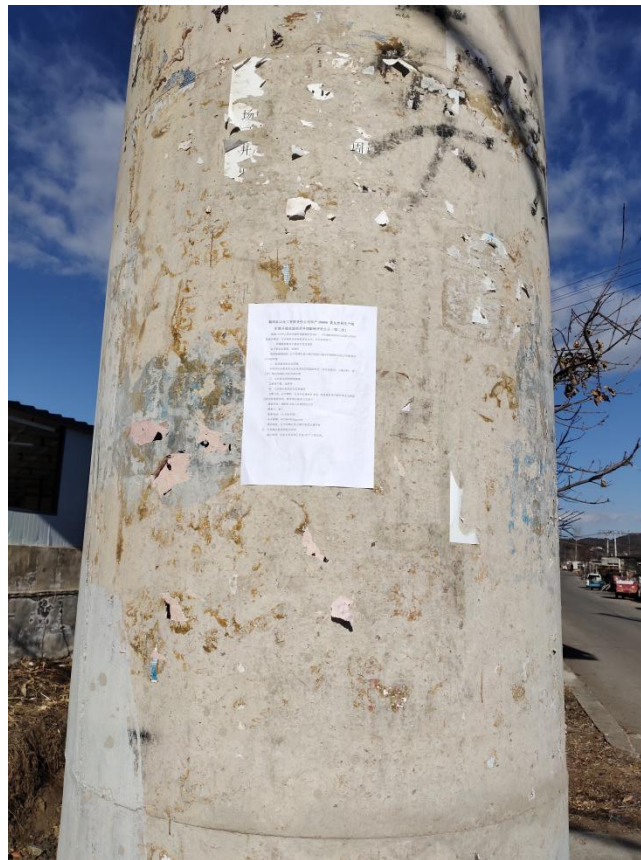
图 3-4.4 窑上张贴公示