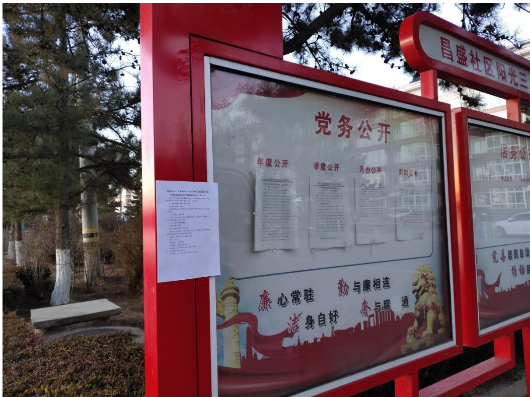
图 3-4.2 喀左县张贴公示