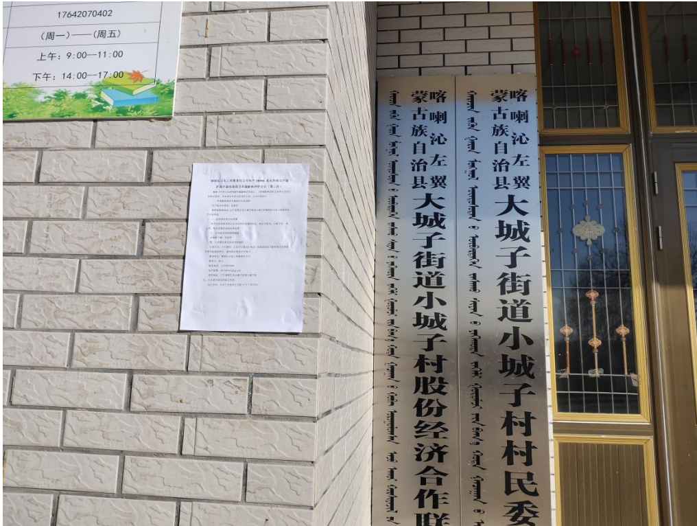
图 3-4.3 小城子村张贴公示