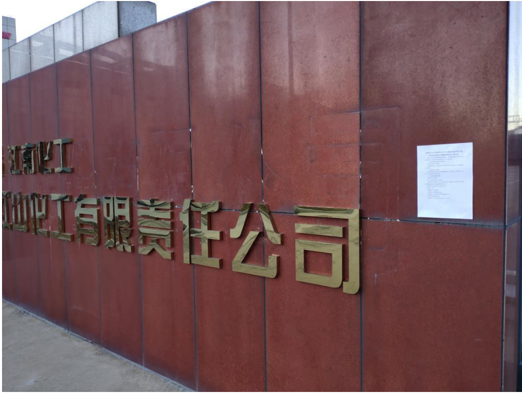
图 3-4.1 企业门口张贴公示