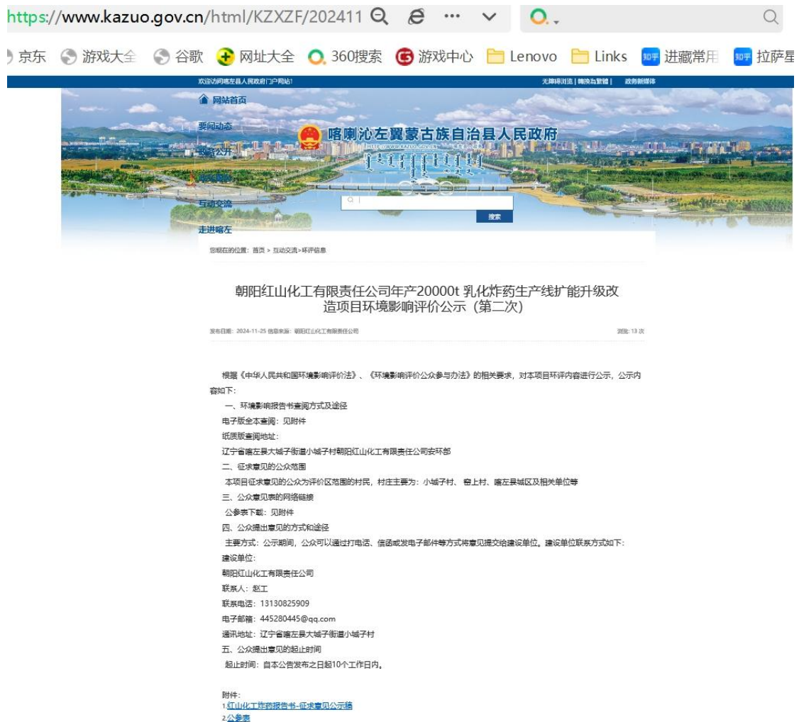
图 3-1 第二次网络公示环境影响评价信息公开情况截图

https://www.kazuo.gov.cn/html/KZXZF/202411/0173251297304575.html