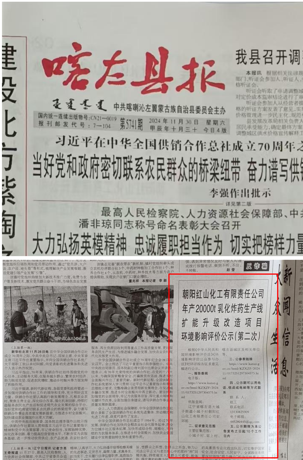
图 3-3 征求意见稿报纸公示——《喀左县报》