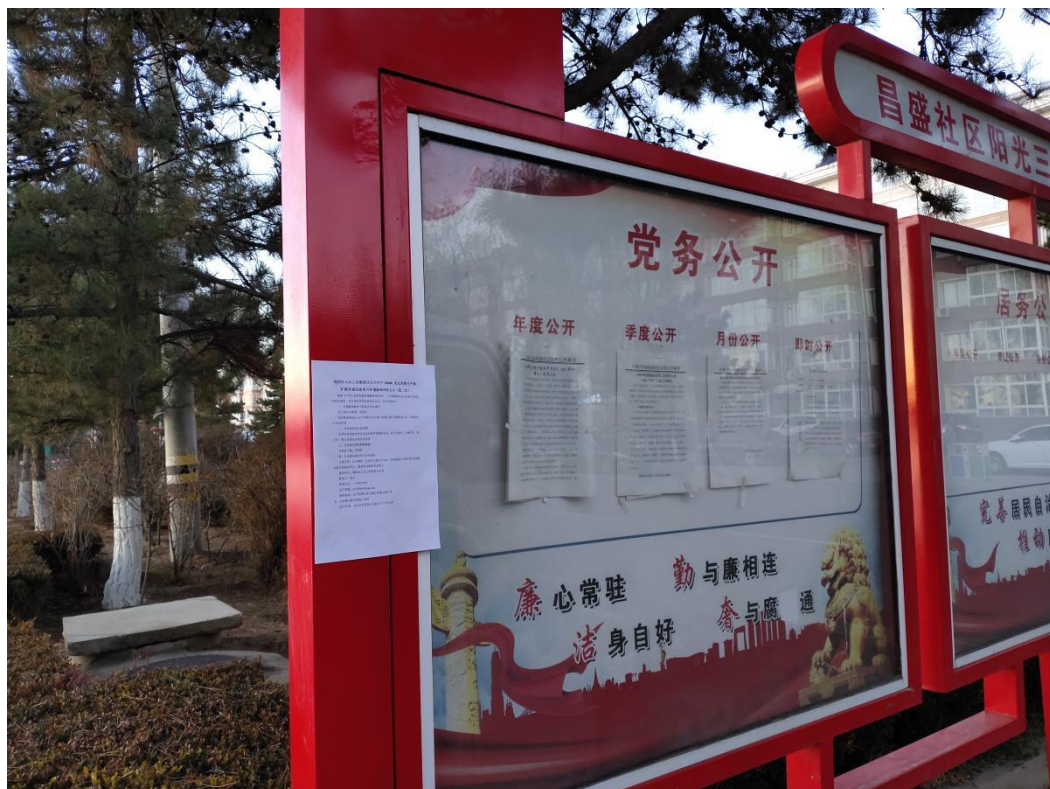
图 3-4.2 喀左县张贴公示