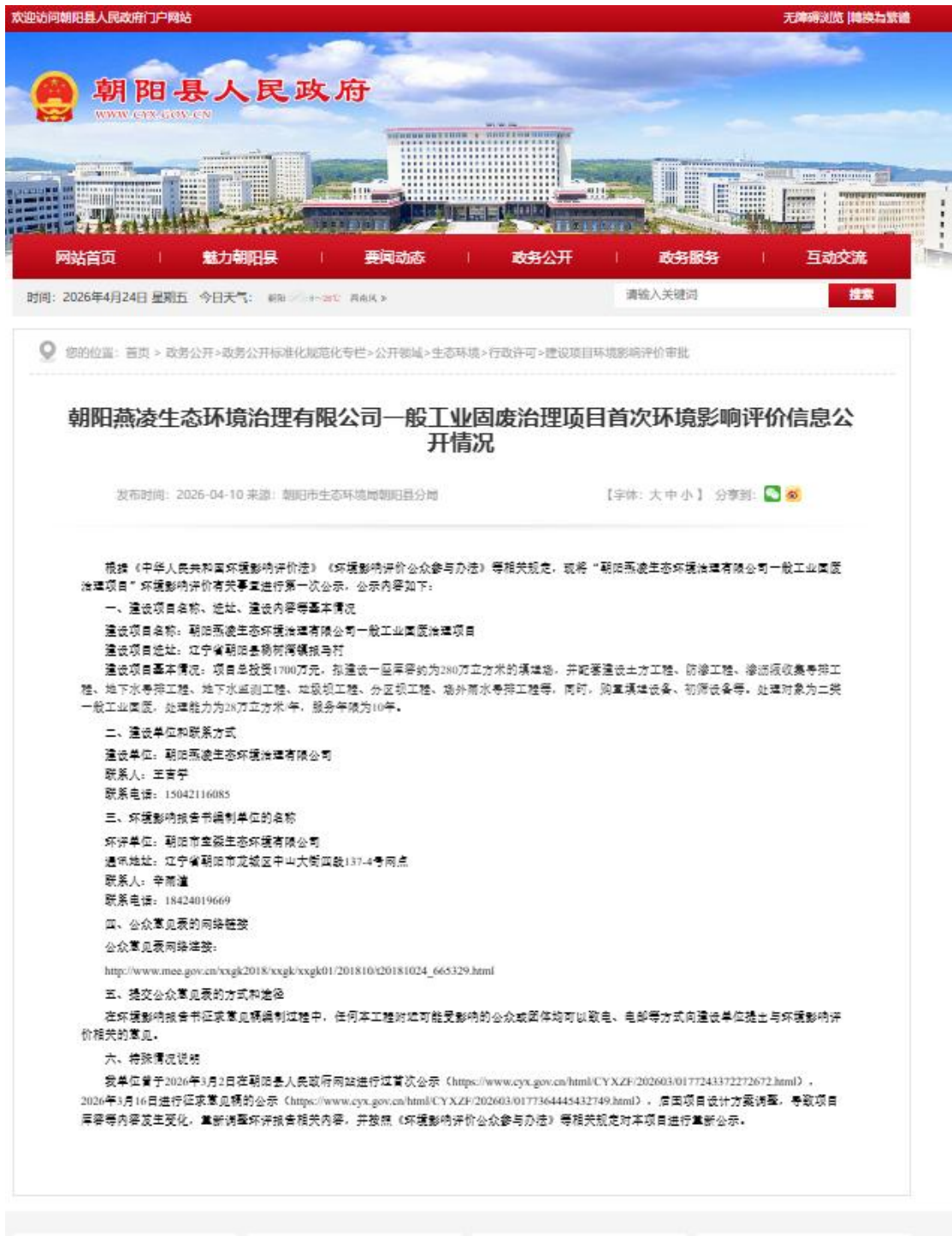
图 1 第一次网络公示截图

由此可见,燕凌公司在确定了承担环境影响评价工作的环境影响评价机构后向公众公告了信息,符合要求。