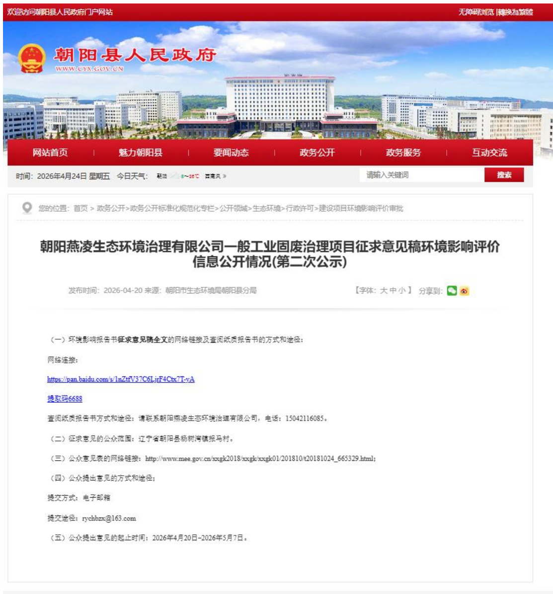
图 2 第二次网络公示截图