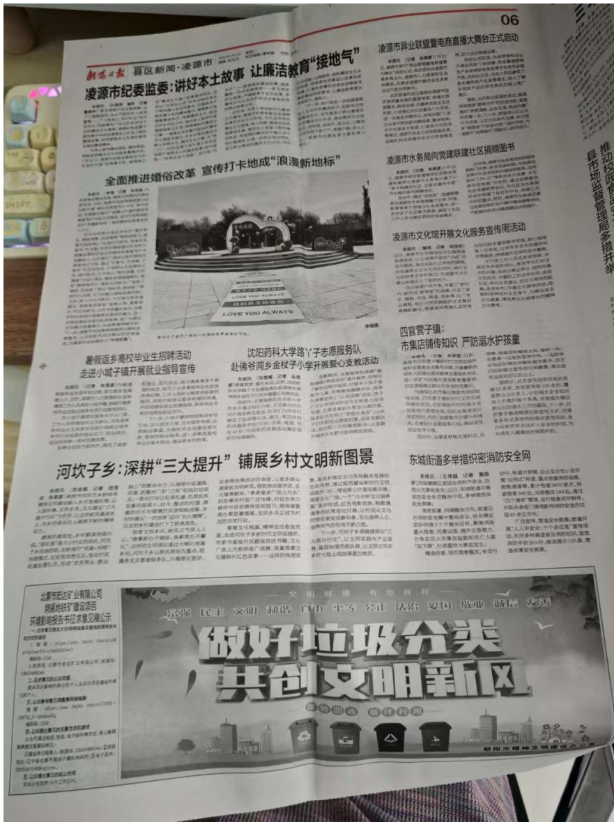
图 3-3 二次报纸公示照片 (2)