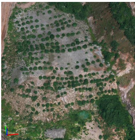
图 2-5 治理后 效果

朝阳市自然资源局于 2024 年组织专家对上述治理工程进行竣工验收，验收合格。目前，矿山种植的植被长势良好，成活率较高。说明矿山的治理和复垦工程措施是可行的，其工程设计可以作为本次环境保护与土地复垦工程设计的参考。治理效果见图。